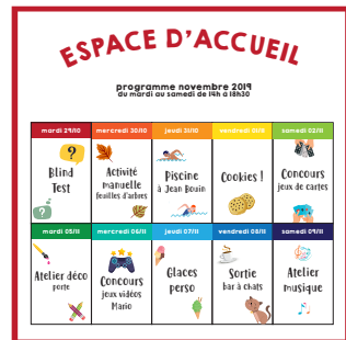
exemple de planning à la quinzaine

Nos jeunes services civiques sont là pour apporter une écoute et une aide si besoin.